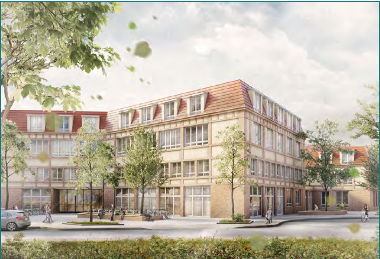
Visualisierung des Schulgebäudes © Fuchshuber Architekten

Verschiedene Kursangebote entstehen in einem Aushandlungsprozess zwischen Kind, Lernbegleiter*in und Eltern. Um einen Überblick über die individuellen Lernerfolge und den Stand in verschiedenen Bereichen bekommen gibt es „ Sprechende Wände “, an denen täglich der aktuelle Stand der Projekte durch Kinder und Lernbegleiter*innen festgehalten wird und die zur Selbstreflexion beitragen.